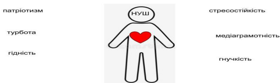
Рисунок 4. Ціннісний портрет сучасного учителя

Педагогами Київської області, слухачами курсів підвищення кваліфікації КНЗ КОР «Київський обласний інститут післядипломної освіти педагогічних кадрів» із проблеми «Ціннісні орієнтири педагога Нової української школи» (з компонентом медіаграмотності), було створено орієнтовний ціннісний портрет сучасного учителя (Рис.4):