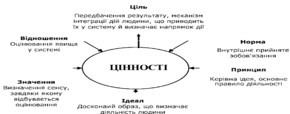
Рис. 1. Структура цінностей

Вивченням ціннісного становлення особистості займається Людмила Романюк, професорка, докторка психологічних наук, результати досліджень якої висвітлено в низці статей («Психодіагностичні методи дослідження ціннісного становлення особистості», 2018; Романюк Л. Бабич М., Соловей О. «Культурний контекст та крос-культурні співвідношення у становленні особистісних цінностей і суб'єктивного благополуччя», 2019). Питання формування та розвитку цінностей досліджує Наталія Павлик, докторка психологічних наук, старша наукова співробітниця ІПОД імені Івана Зязюна НАПН України («Ціннісно-сміслові детермінанти зв'язку між життєвими і професійними кризами особистості»). У сучасній культурі послуговуються поняттям пріоритетних, загальнолюдських, вищих цінностей – правда, краса, мета, гармонія, активність, унікальність, досконалість, потреба й необхідність, завершеність, справедливість, порядок, простота, багатство, спокій, воля, гра, самодостатність. Структуру цінностей (Романюк, 2017) можна представити у схемі (Рис.1).