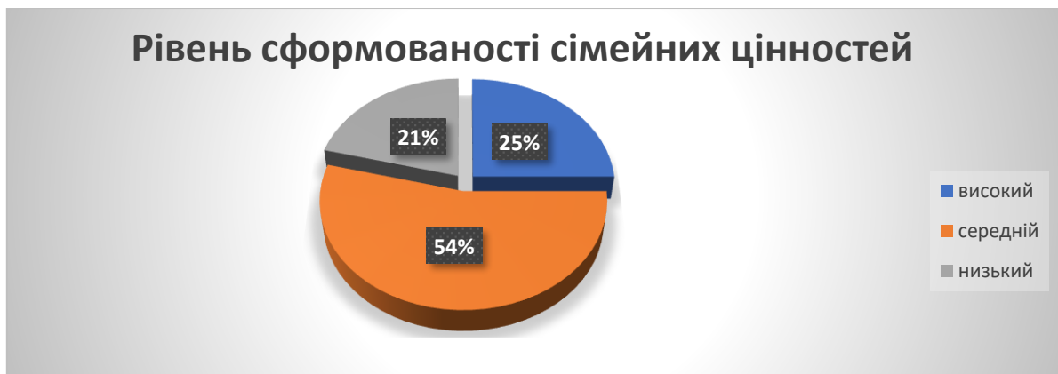
Рисунок 4. Рівень сформованості сімейних цінностей.

Тому доцільно висвітлити загальний рівень сформованості ціннісного ставлення дітей до сім'ї (Рис.4).