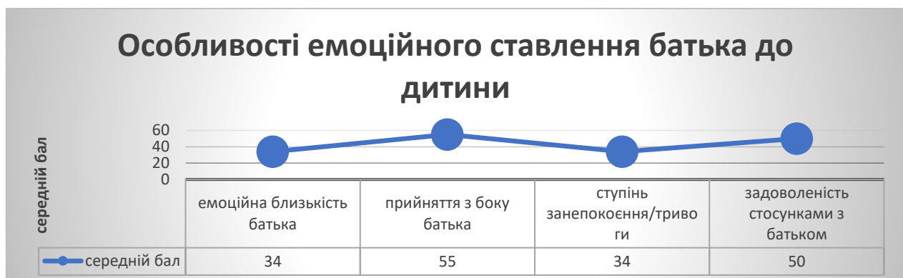
Рисунок 2. Особливості емоційного ставлення батька до дитини за методикою «Взаємодія батько – дитина»

Лише 32% татусів, зі слів респондентів-дітей, цікавляться їхнім життям і почуттями, прагнуть бути в курсі всього, що відбувається, надають підтримку і намагаються проводити якомога більше часу разом. Однак є відсторонені та холодні батьки (27%), яким байдуже до інтересів та емоцій дітей. Особливості емоційного ставлення батька до дитини доречно проілюструвати (Рис.2; використано стандартизований опитувальник «Взаємодія батько – дитина»).