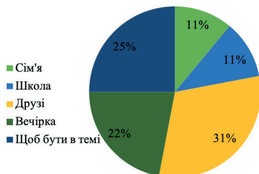
Рис.2. Чому починають вживати наркотики

З рис.2 ми бачимо, що є п'ять чинників які впливають на першу спробу наркотику. Серед найбільш впливових – друзі, так вважають 31%±34 опитаних. Далі – «щоб бути в темі (тренді)» 25%±2,9 опитаних так вважають. Наступний – вечірка, де під станом алкогольного сп'яніння можливе і вживання наркотиків із цим погоджуються 22%±2,7. І по 11%±2 вважають, що школа та сім'я впливають на людину при першій спробі наркотиків.